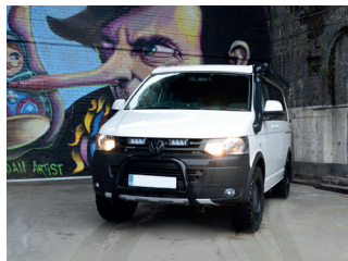
VW TRANSPORTER 5 2010+