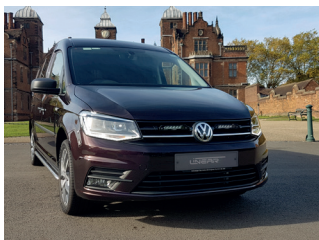
VW CADDY 2015+