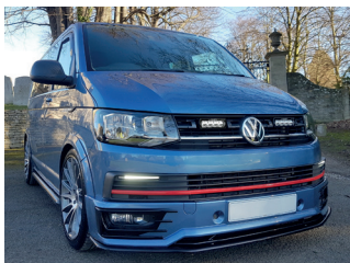
VW TRANSPORTER 6 2016+