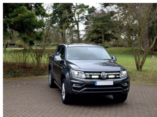
VW AMAROK V6 2016+