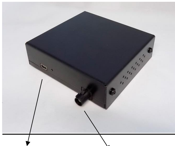
(a) USB til softwareoppdatering